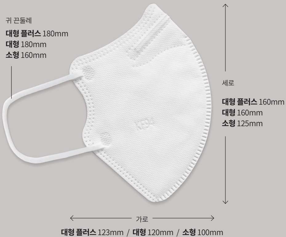
KF94 마스크 필터 시험 성적서

각 부위 별(가로×세로) 10mm, 귀 끈 10% 개인 신체 사이즈에 따라, 편차가 있을 수 있습니다.